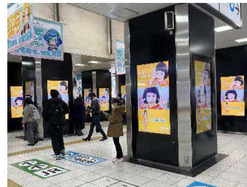
高田馬場駅デジタルサイネージ

集中的にプロモーションを実施した令和5年1月の1か月間の相談件数は, 98件となっており, 前年同月14件の7倍となっている。