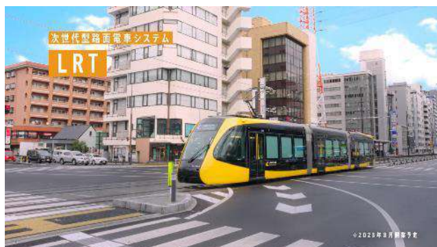
テレビCM(まちの先進性・利便性LRT)

⇒ SNS等において、市民や本市にゆかりのある方などから喜びや驚きの声 が多数寄せられ、シビックプライドの醸成にもつながった。