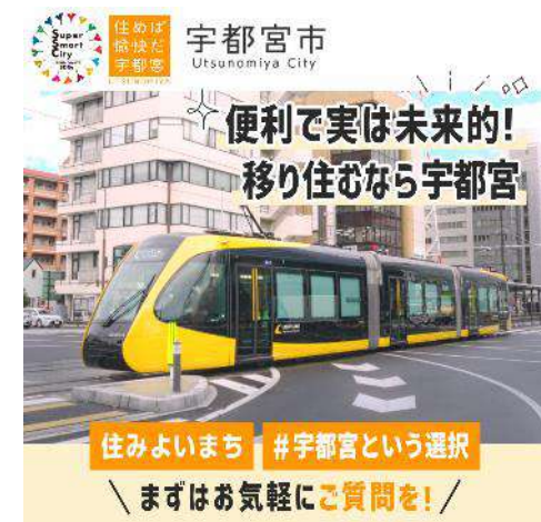
インターネット広告イメージ