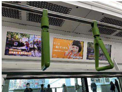
山手線窓上チャンネル