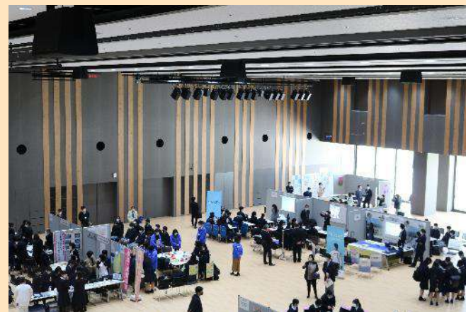
会場の様子(じぶん×未来フェア)