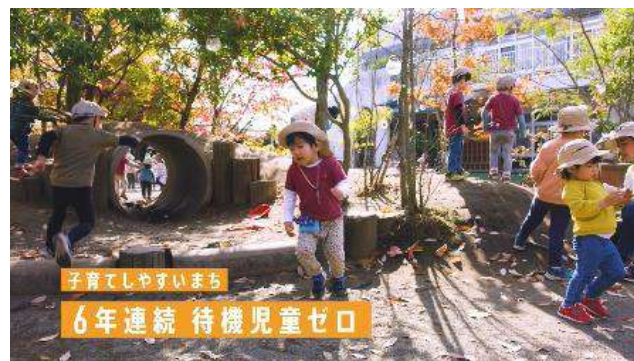
テレビCM(充実した子育て環境)