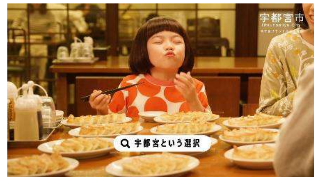
テレビCM(特設HPへの誘導)